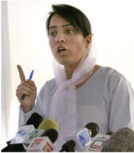
Malalai Joya, en una roda de premsa a Kabul el 21 de maig de 2007, promet continuar la seua lluita contra els senyors de la guerra.

Durant les passades setmanes, després del retorn de Malalai Joya d'una fructífera gira per l'estranger i una entrevista concedida per a una emissora de televisió a Kabul, els senyors de la guerra i els criminals presents en el Parlament i el Senat afganesos, han intentat silenciar Joya i llevar-la del seu escó de parlamentària.