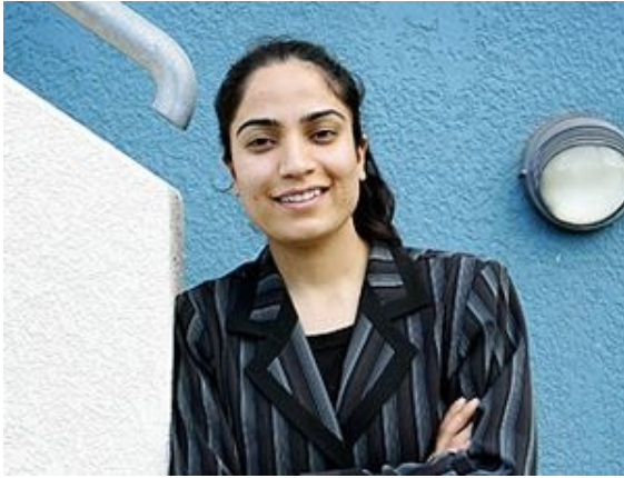
Malalai Joya, la més jove del Parlament de l'Afganistan